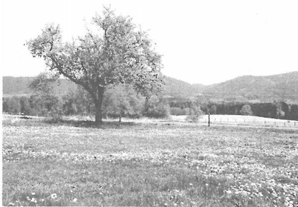
Stará hrušeň u manského dvora je výraznou krajinnou dominantou.

území dnešní ČHKO Slavkovský les a Přírodního parku Český les značně lišila od současného stavu. Po druhé světové válce došlo k odsunu původních, převážně německých obyvatel, zmizely celé vesnice a na jejich místech lze stále ještě nalézt staré, často již odumírající druhy původních ovocných stromů. S odsunem starousedlíků došlo k naprosté ztrátě kontinuity a znalosti místních odrůd ovoce; zmizely odrůdy, které zde byly po generace pěstovány, a které byly vhodné pro místní klimatické podmínky.