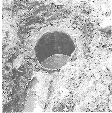
Historické jímání v dřevěném soudku.

aktivu při Správě CHKO Slavkovský les. Pod těmito vrstvami se však nacházela ještě starší vrstva dalších kamenů a vrstvy písku.