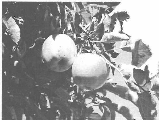
Odrůda citrónové zimní v býv. vsi Bystřina.

V období mezi světovými válkami se skladba a množství ovocných dřevin na